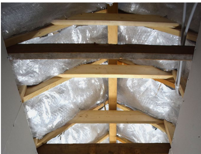
Er is nu geen aparte dampfolie meer nodig

“Iso booster Professional is onze meest robuuste lijn die voldoet aan de allerhoogste waarden. Sinds 2015 is het product voorzien van de BCRG-Gelijkheidsverklaring. We zien dat hiermee zelfs monumenten op het hoogste isolatieniveau worden gebracht en in veel gevallen ook nog eens in aanmerking komen voor subsidies zoals de ISDE.”